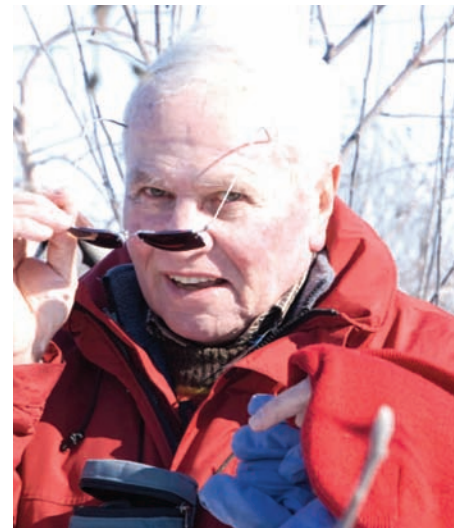
À l'origine, c'est Jean-Marie Lespinasse, de l'INRA (Bordeaux, France), qui fournissait le matériel génétique de la collection variétale plantée en 1986.

Bien que ces tableaux ne soient réalisés que depuis 2003, et que l'évaluation du goût peut paraître subjective, ils fournissent des indices essentiels pour le choix des sujets en création variétale. Les notes sont donc attribuées à la suite de données d'observation et de mesures qui sont consignées avec toute la rigueur scientifique qui s'impose.