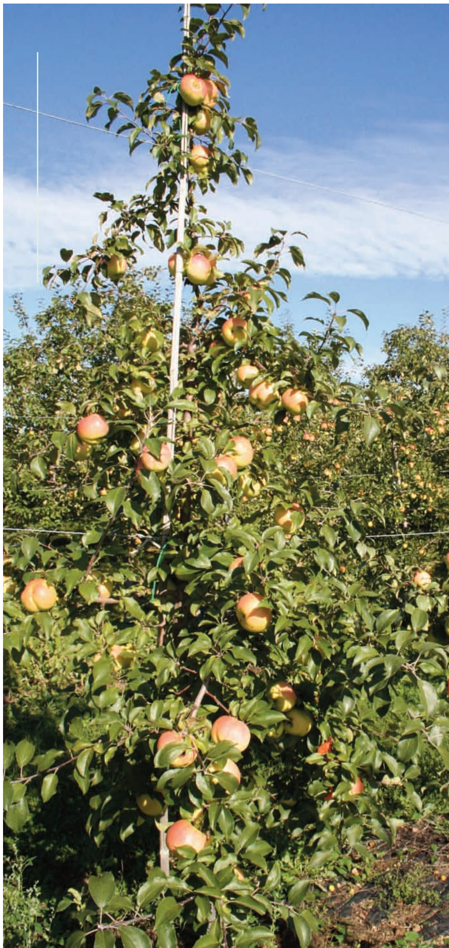
La Q-370 produit un arbre avec bourse terminale, facile à conduire, productif et dont la mise à fruit est précoce.

Q-370 ça vous dit quelque chose ? Non ce n'est pas un astéroïde, ni le prochain numéro de votre plaque de voiture. C'est bel et bien le numéro d'identification d'une nouvelle variété de pomme dont la demande de brevet a été faite en 2009 par le groupe La pomme de Demain. Un nom commercial officiel lui sera attribué vers 2013, car des données botaniques supplémentaires doivent être fournies pour assurer la protection de la variété et profiter des droits de multiplication.