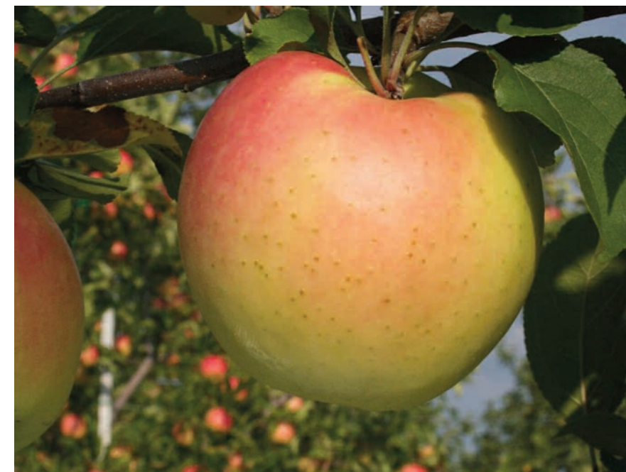
Le fruit de la Q-370 est de couleur jaune, avec un fini de teinte rosée sur sa face exposée au soleil.