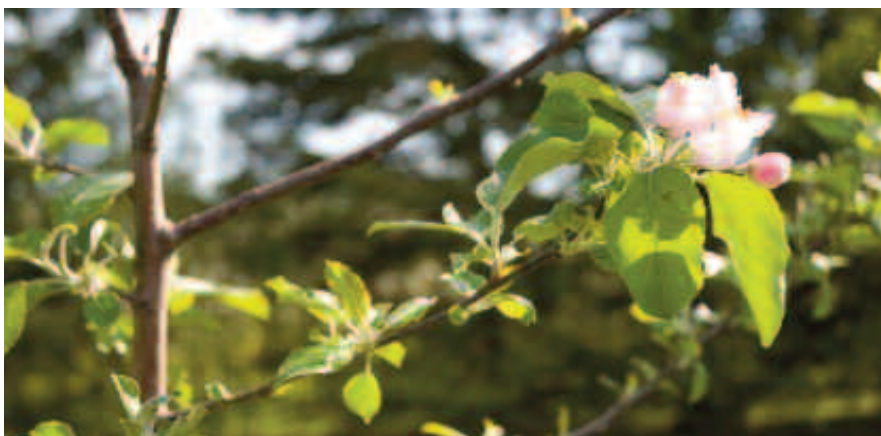
Parcelle hybride de 2 ans en observation possédant des caractères spécifiques recherchés : une pelure en bout de pousse, donc une bourse terminale et une facilité de conduite de l'arbre.

Suite aux caractères observés, la variété fera partie du tableau des croisements. Il arrive aussi que les producteurs de La Pomme de Demain mettent ces variétés à l'essai sur leur site, pour les besoins de leur marché. Ce fut le cas pour quelques variétés de la parcelle de collection. En effet la Primgold (5 ha), Delcorf (2 ha), et Delbard estivale (1 ha), bien que ce soient des variétés hâtives, font l'objet d'un petit développement. Leur goût est remarquable et ces variétés se vendent deux fois le prix des McIntosh à l'auto-cueillette ou en kiosque. Dans la gamme tardive, la Gala Grise