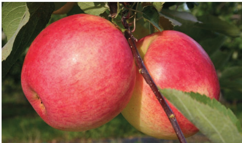
Cette Q-300 est une autre des rares élues issue des 1 100 hybrides ensemencés en 1994.