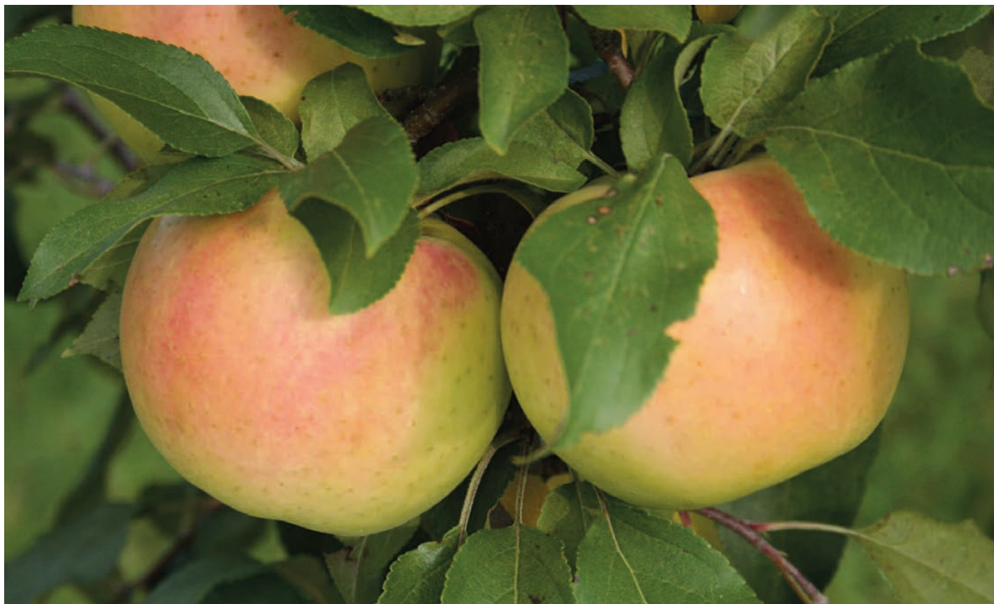
Des résultats, telle cette Q-370, sont prometteurs pour notre pomiculture de demain et proviennent de l'initiative exemplaire des individus, des hommes d'affaires de La Pomme de Demain.